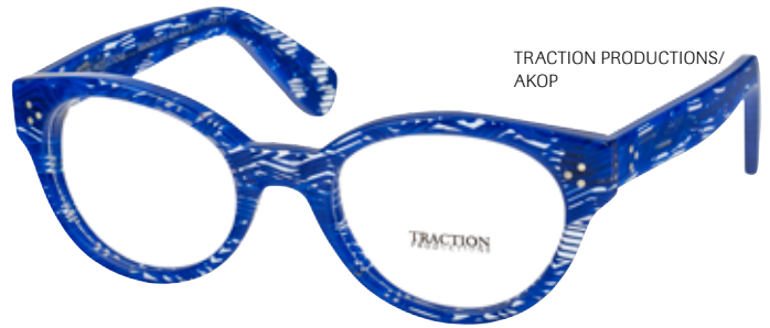
TRACTION PRODUCTIONS/ AKOP