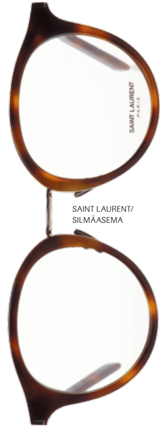
SAINT LAURENT/ SILMÄSEMA