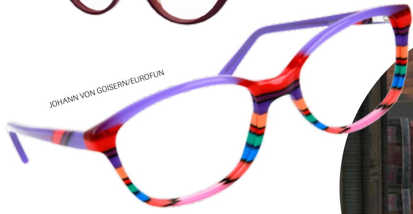
JOHANN VON GOISERN/EUROFUN