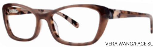
VERA WANG/FACE SUN