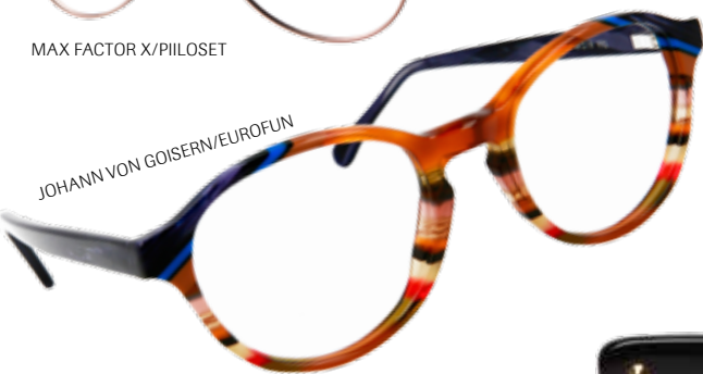
JOHANN VON GOISERN/EUROFUN