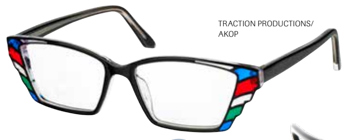
TRACTION PRODUCTIONS/ AKOP