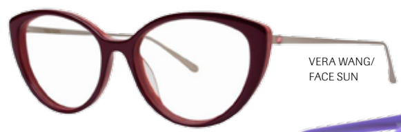
VERA WANG/ FACE SUN