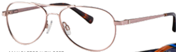
MAX FACTOR X/PIILOSET